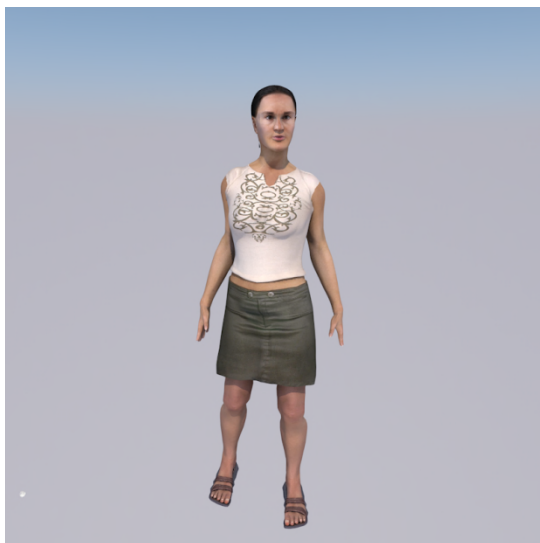
En anden kvinde. — Ala @ alâ.