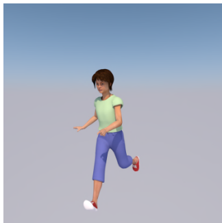
Ke sakiune ? — ... ..