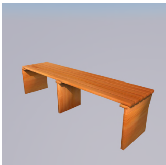
Ke beke ? — ... ..