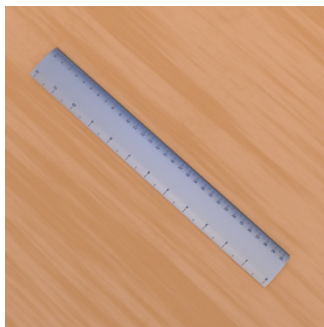
Ke gume ? — Ne, set ... ..