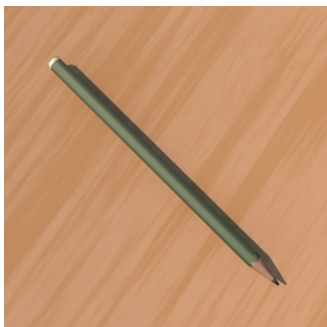
Ke koje ? — We, set koje.