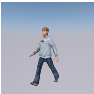
Ko ho ? — Ne, sot ... ..