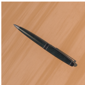
Ke set ? — Set ... ..