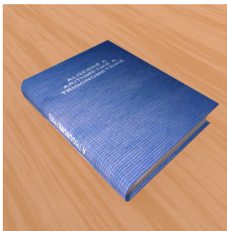
... .. set leje.