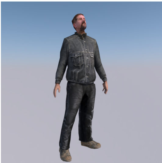
En annan man. — Alo @ alô.