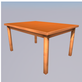
Ke set ? — Set tabe.