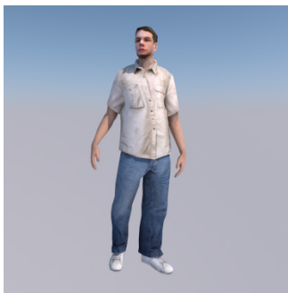
Sot al... ho.