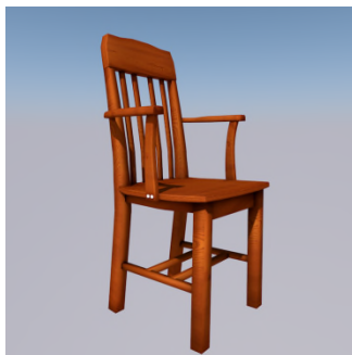
Ke set ? — Set ... ..