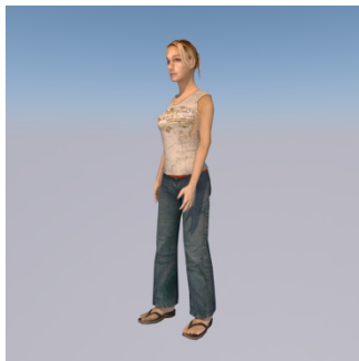
Ke set ? — Sat ... ..