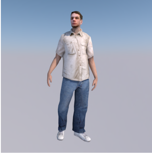
En man. — Ho @ shô.