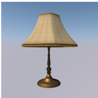
Ke set ? — Set ... ..