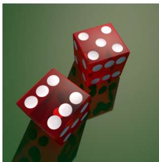
11, dek unu. — JH , Jiehi . @ Jiéshi.