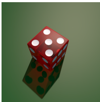
5, kvin. — V, Vi. @ vi.