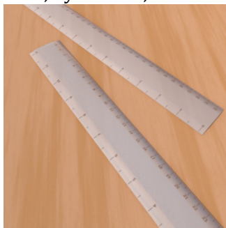
Ke H rige ? — Ne, seti ... .. .