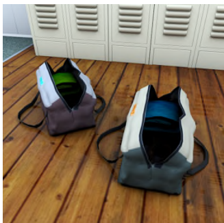
Ke set ? — Seti ... ..