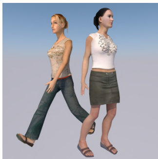
Ke set ? — Sati ... ..