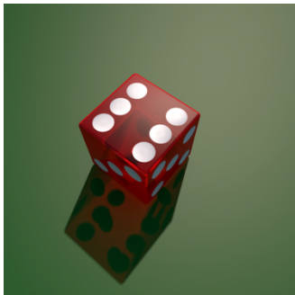
6, ses. — S , Si . @ si.

1+1=2, Unu plus unu egalas du — HEH QD , Hiehi qi Di @ shiéshi kwi di .