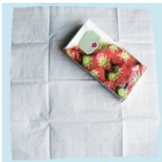
Ke set ? — Set mukîze.