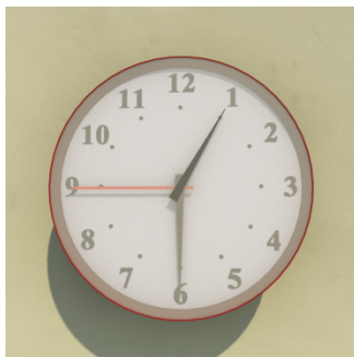
Ke set ? — Set ... ..