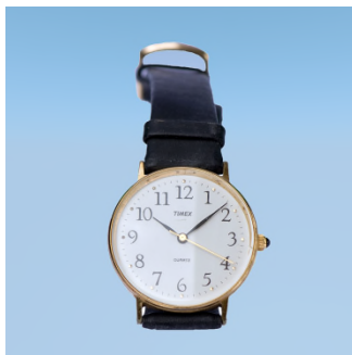
Ke set keje ? — Ne, ny set ... .. , set ... .. .