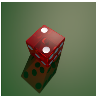
2, du. — D, Di. @ di.