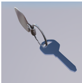
Ke set ? — Set ... ..