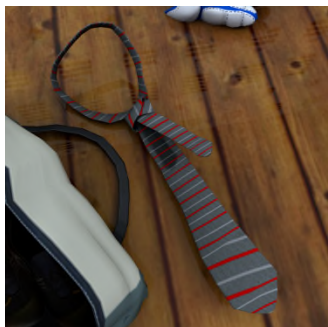
Ke set node ? — ... .. .