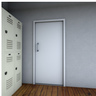
Ke set pere ? — We, set pere.