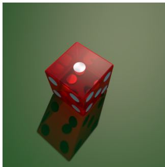
1, unu. — H, Hi. @ shi.