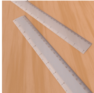
Ke H rige ? — Ne, seti ... .. .