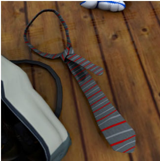
Ke set node ? — ... .. .