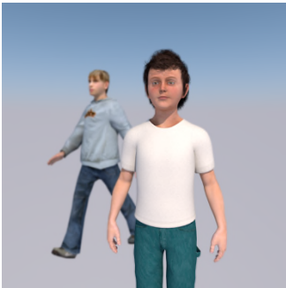
Koi soti ? — Soti Di ... .. .