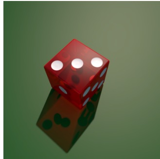
3, drie. — T, Ti. @ ti.