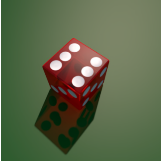
6, zes. — S, Si. @ si.

1+1=2, één plus één is twee — HEH QD , Hiehi qi Di @ shiéshi kwi di .