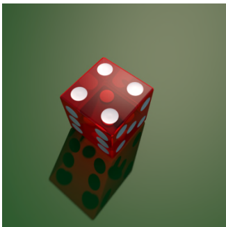
4, vier. — F, Fi. @ fi.