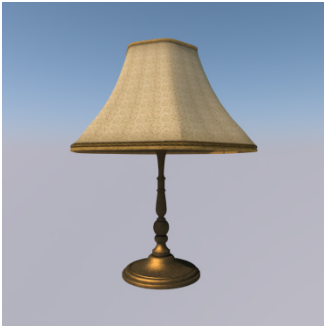
Ke set ? — Set ... ..