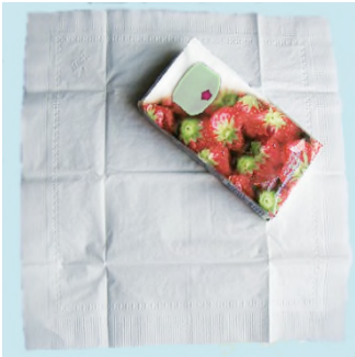
Ke set ? — Set mukîze.