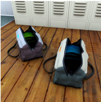
Ke set ? — Seti ... ..