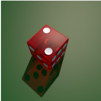
2, twee. — D, Di. @ di.