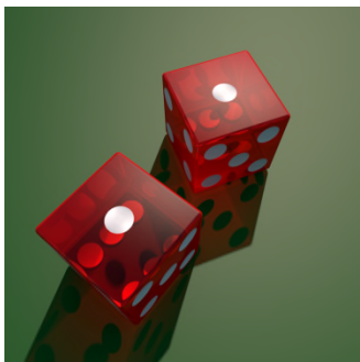
Ki ? Hi ei Hi qi Di.