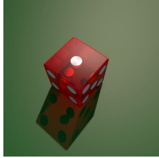
1, één. — H, Hi. @ shi.