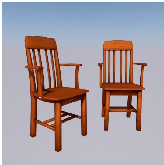
Stolar. — Hei sedei @ shêi sédêi @ shêi siédêi .