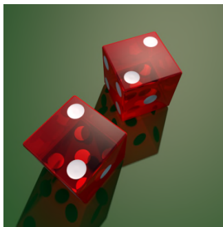
Ki ? ... ei ... qi Fi.